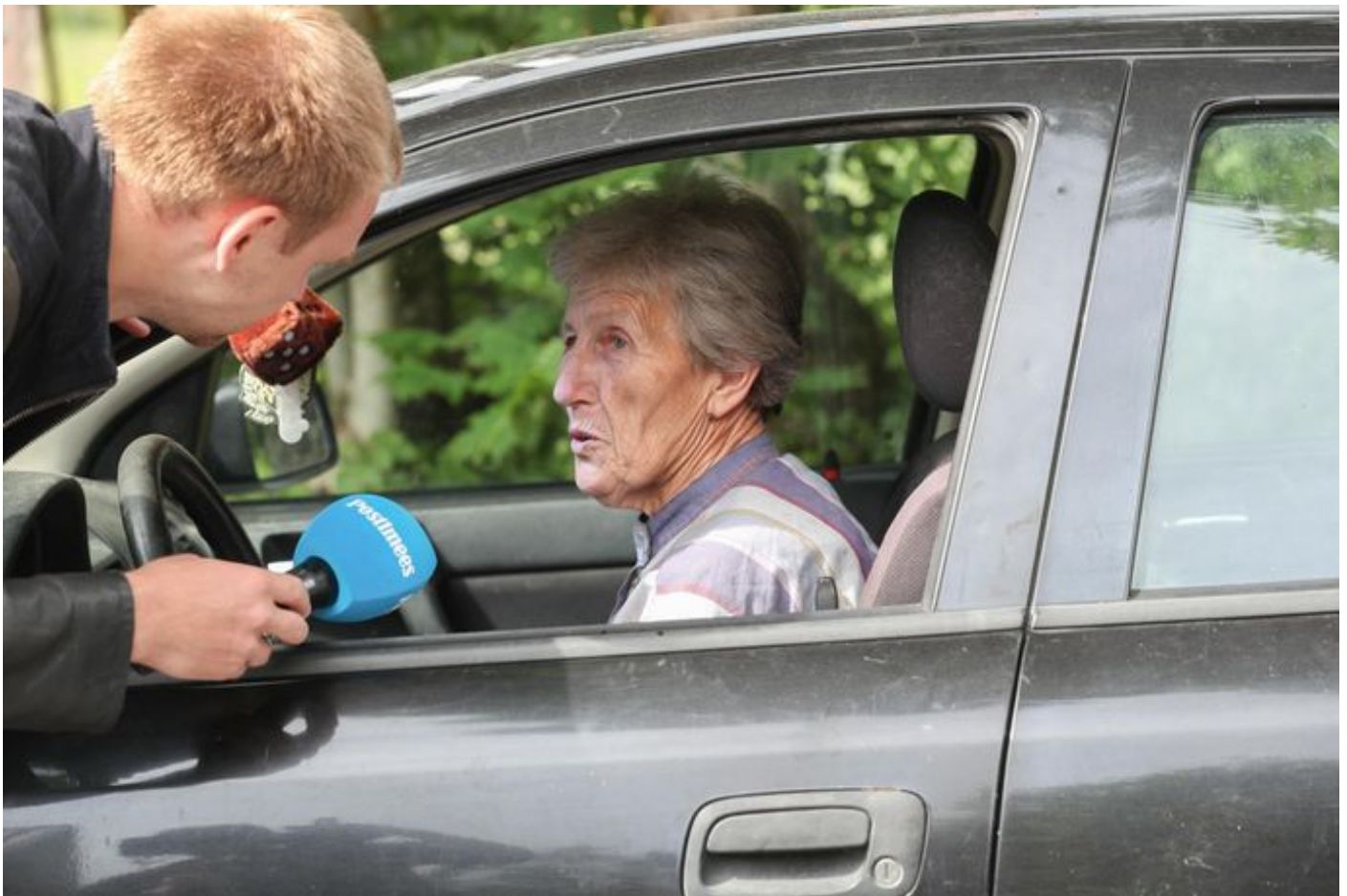
Kus tegijaid, sel arvajaid.