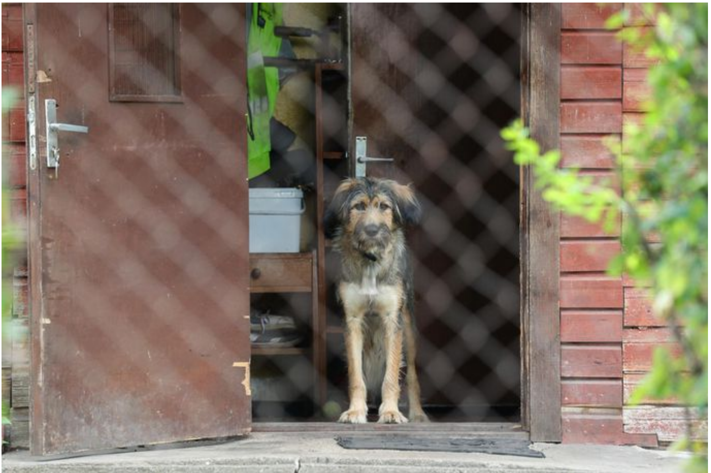
Paik, kus toimus intsident purjus kodaniku ja politsei vahel, mille tulemusel politseinik tulistas kodaniku surnuks.

Esmaspäeval naabrid ajakirjanikega suhtlema ei soostunud. Siiski võis hoovis märgata meest, kelle küünarnukid olid sidemetes – tõenäoliselt öisest naabrimeeste kukepoksist tingituna, mistõttu politsei üleüldse välja kutsuti.