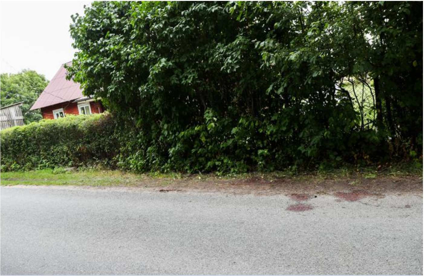
Paik, kus toimus intsident purjus kodaniku ja politsei vahel, mille tulemusel politseinik tulistas kodaniku surnuks.

Pärast emotsionaalset tunnetesööstu mindud siiski uuesti rahulikult magama. Umbes kell 22 sai häirekeskus aga teate, et Läänemaal Haeska külas on purjutaja istunud autorooli ning siis paarikümne meetri kaugusel majast sellega kraavi sõitnud.