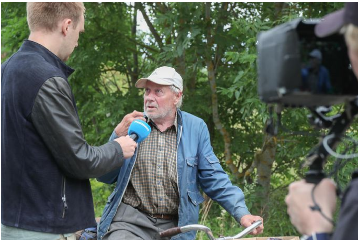
Paik, kus toimus intsident purjus kodaniku ja politsei vahel, mille tulemusel politseinik tulistas kodaniku surnuks.